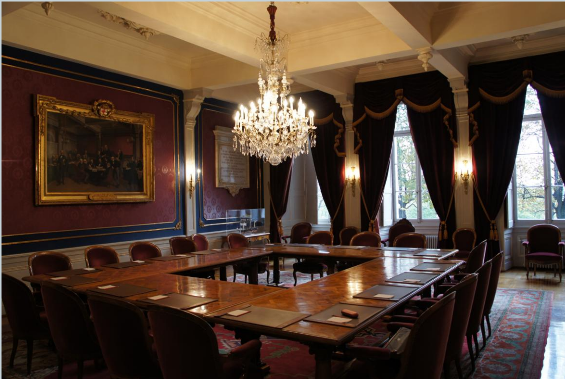
La salle Alabama

Dans cette salle fut signée le 22 août 1864 la Première Convention de Genève