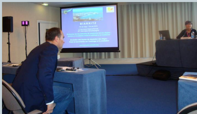
Congrès de l'association Avocat – Conseil – Entreprise (ACE) à Biarritz les 7 et 8 mai 2010